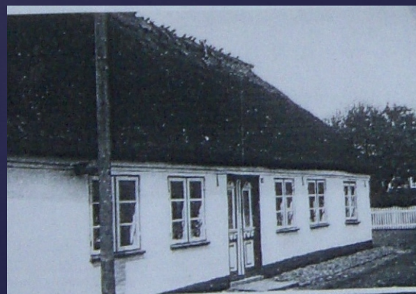
Damgade 45 1930