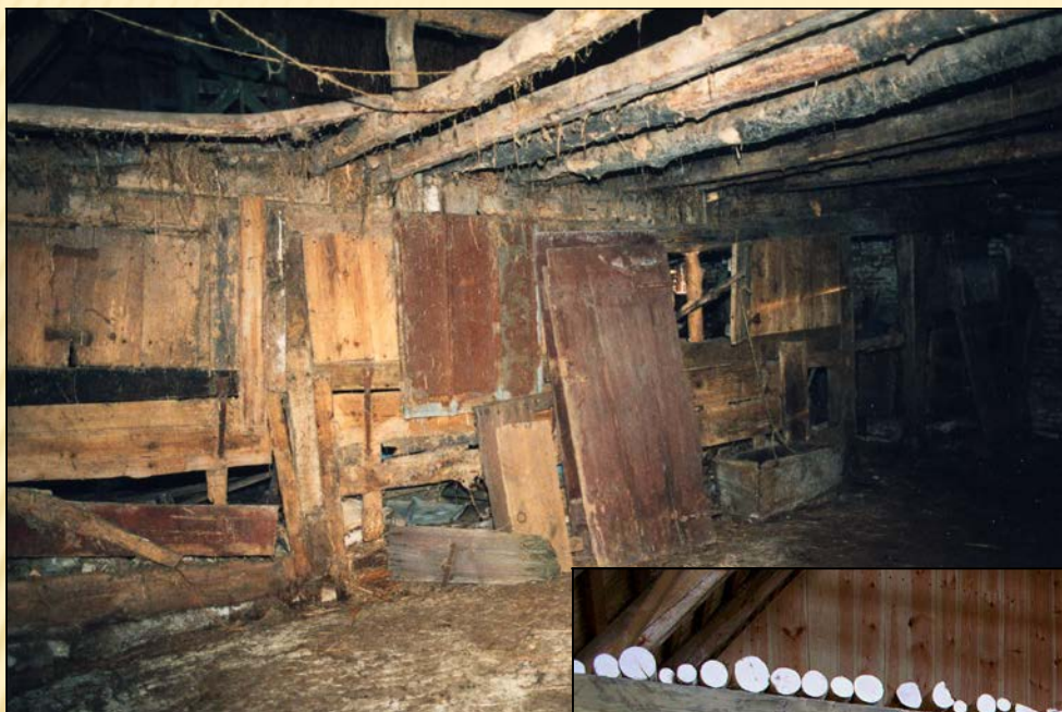
1999 - Gårdens foder lo - set mod sydøst (mod kostalden).