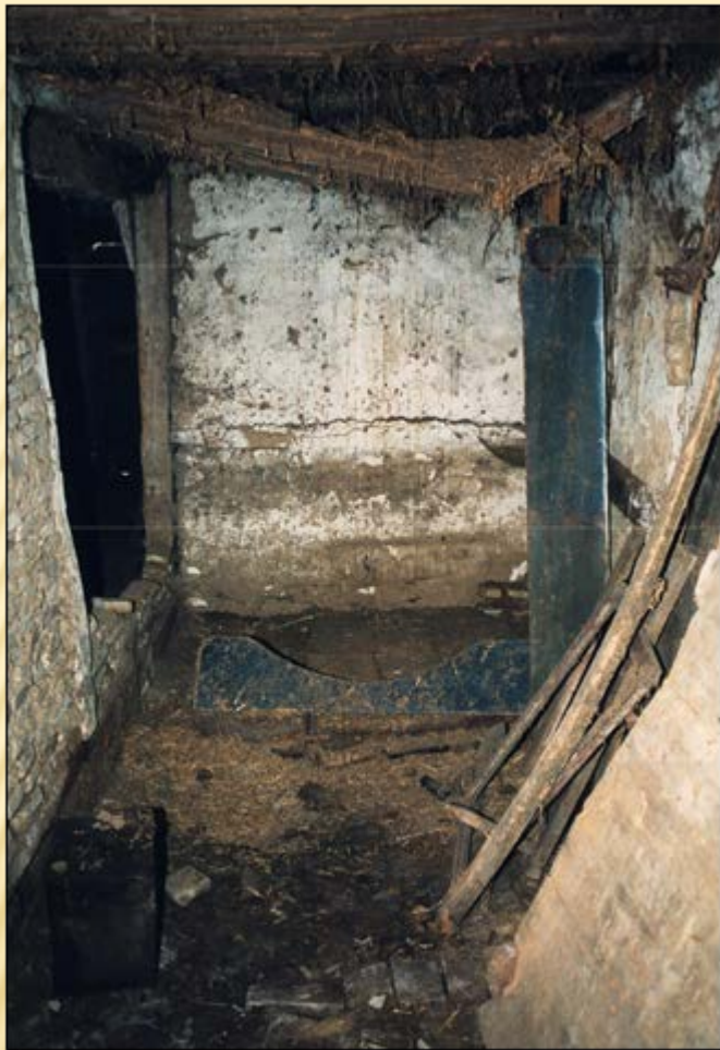
1995 - KARLEKAMME RET - MED FRAGMENTER AF ALKOVE