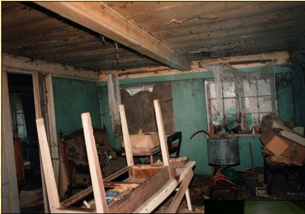
1995 - stuehusets dørnsk (stue) set mod syd.