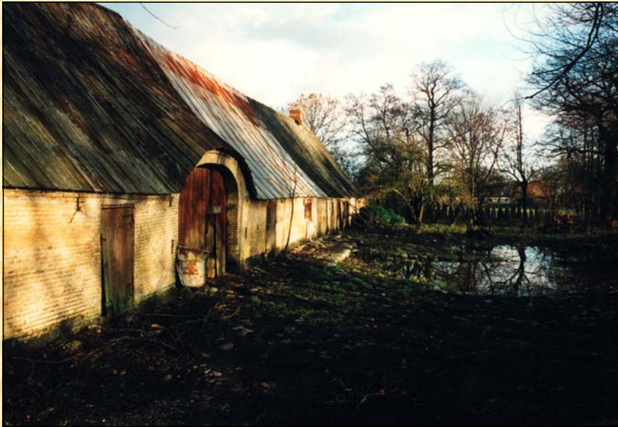
1995 - Sydlængden - set fra vest med møddingen foran.