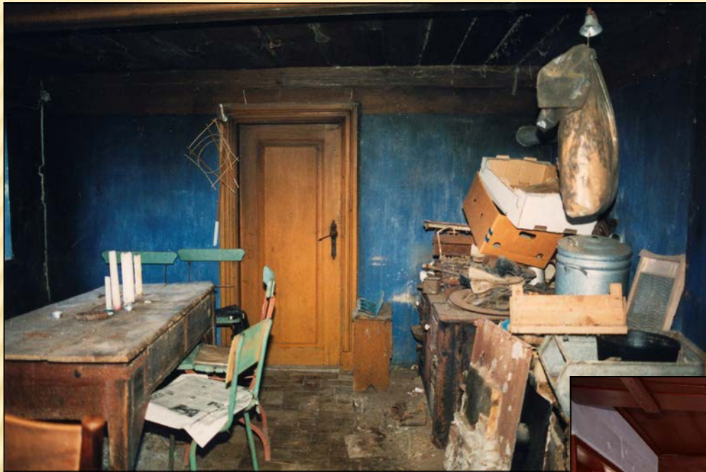
1995 - stuehusets køkken set mod øst (ombygget i 1906)