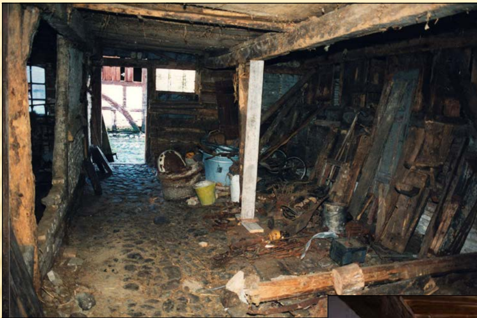
1999 - Gårdens hestestald - set mod nord. Karlekammer bag nedstyrtet skillevæg t.v..

2007 - PIGSTENSBELÆGNINGEN ER URØRT VED RESTAURERINGEN