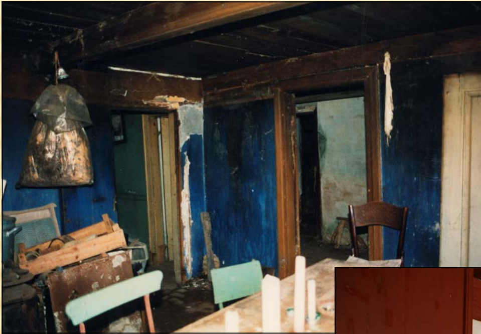
1995 - Stuehusets køkken set mod sydvest.