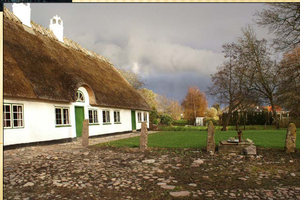
1995 - Stuehusets sydside - set fra sydvest.