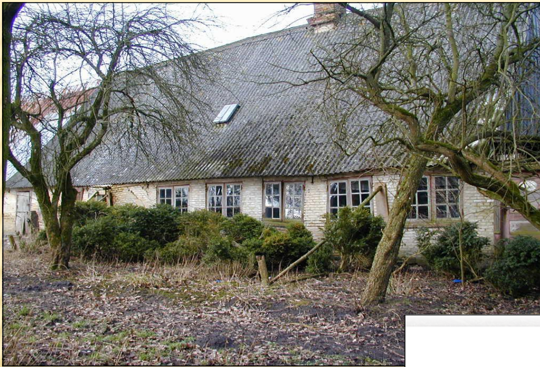
Sydlængdens sydside (østre del med stuehuset).