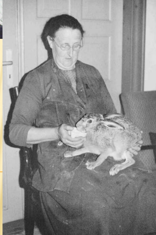
Tinne med hare