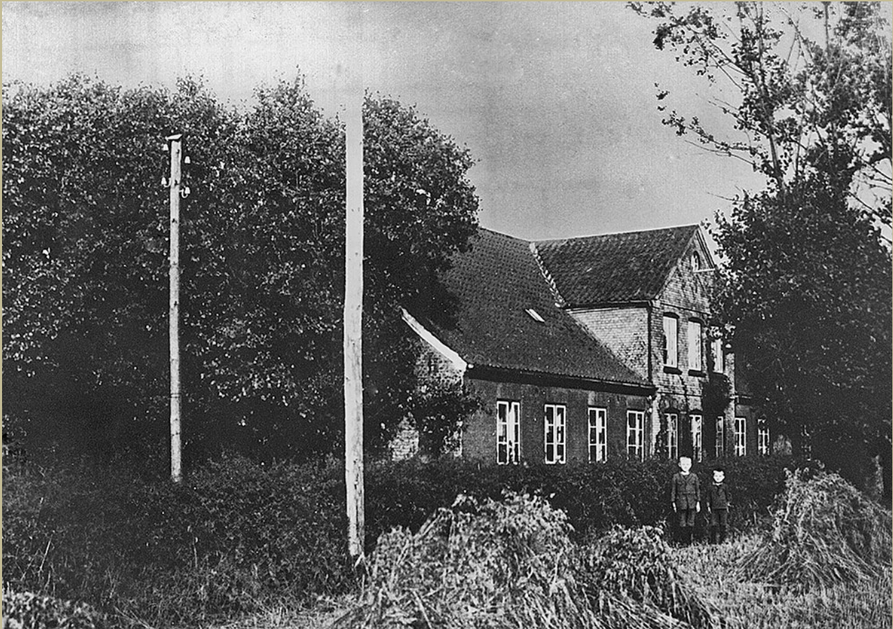
Fattiggårde på landet i sønderjylland